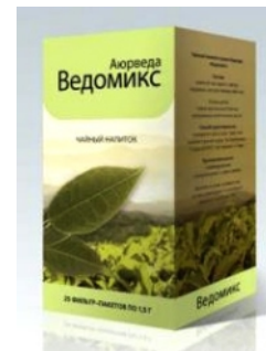
ЕКСКЛУЗИВНА линија биљних чајева "Ајурведа" четврте генерације на основу ајурведског и традиционалног биља и зачина