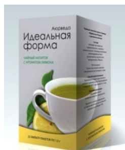
Серија ароматизованих чајева дизајнирана да оптимизује метаболизам и варење.

Ово је ЗЛАТАН ПРЕПАРАТ. То је најважнији препарат, он даје максимално смањење рака дојке.