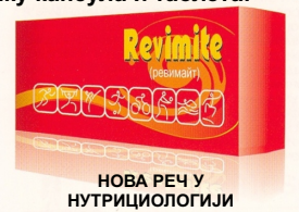
НОВА РЕЧ У НУТРИЦИОЛОГИЈИ