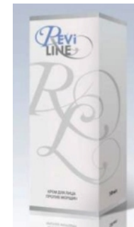
ЋЕЛИЈСКА КОЗМЕТИКА REVILINE ПРОИЗВОДИ ВИСОКЕ ТЕХНОЛОГИЈЕ ПЕПТИДНА СЕРИЈА