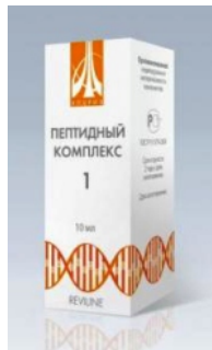
Пептидни комплекс за артерије и срца

Отпорност организма је пре свега имуни систем. За њега је одговоран тимус - он је, као главни командант, обезбеђује нормалну интеракцију свих "јединица" у организму. Ако тимус добро ради, онда ће људи бити здрави и јаки, без обзира на разне инфекције око њих.